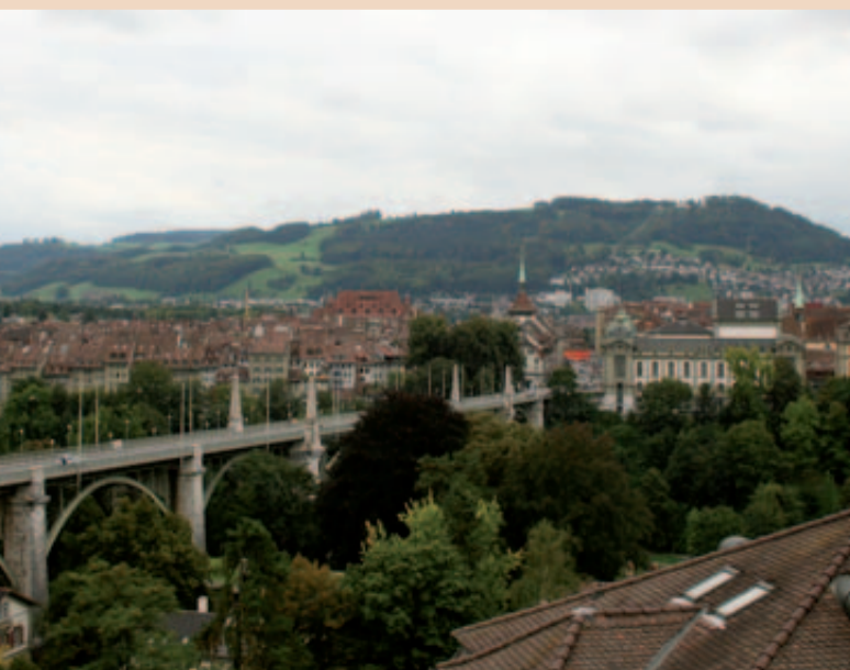
Von der Terrasse des Casino Bern bot sich ein herrlicher Blick auf die Berner Innenstadt.

Wir bitten unsere Leserinnen und Leser um freundliche Beachtung. Vielen Dank.